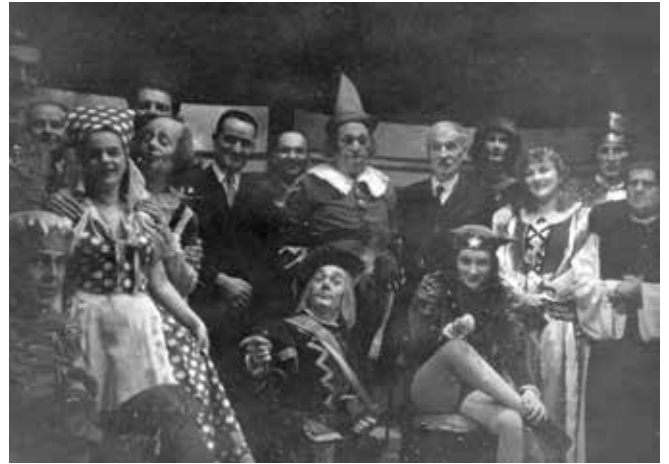
Богојављенска ноћ , 1939.