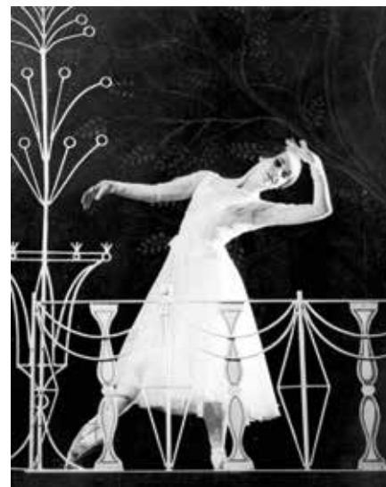
Душка Сифниос Ромео и Јулија , 1965.