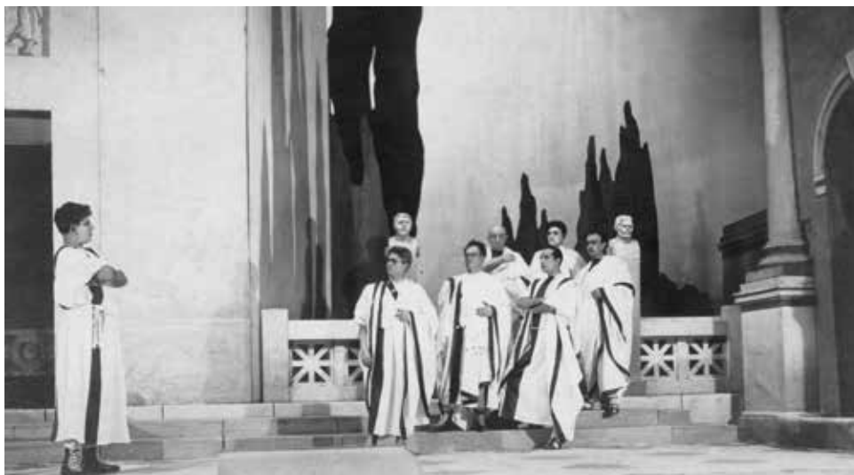
Јулије Цезар , 1925.