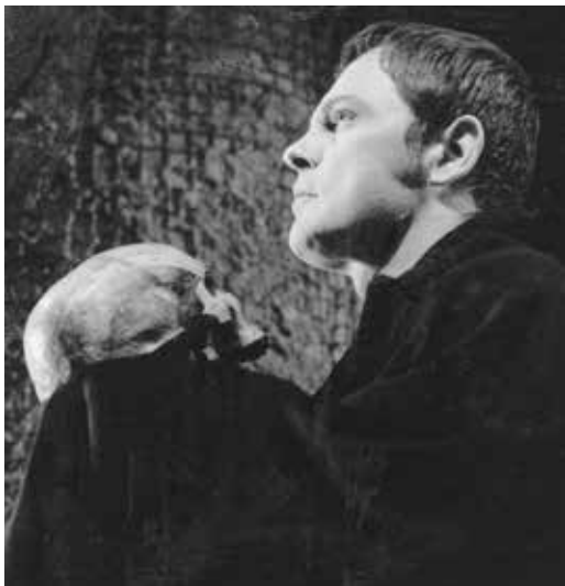
Петар Банићевић Хамлет , 1970.