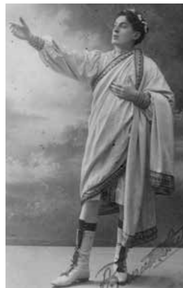
Александар Златковић, Сан летње ноћи , 1920.