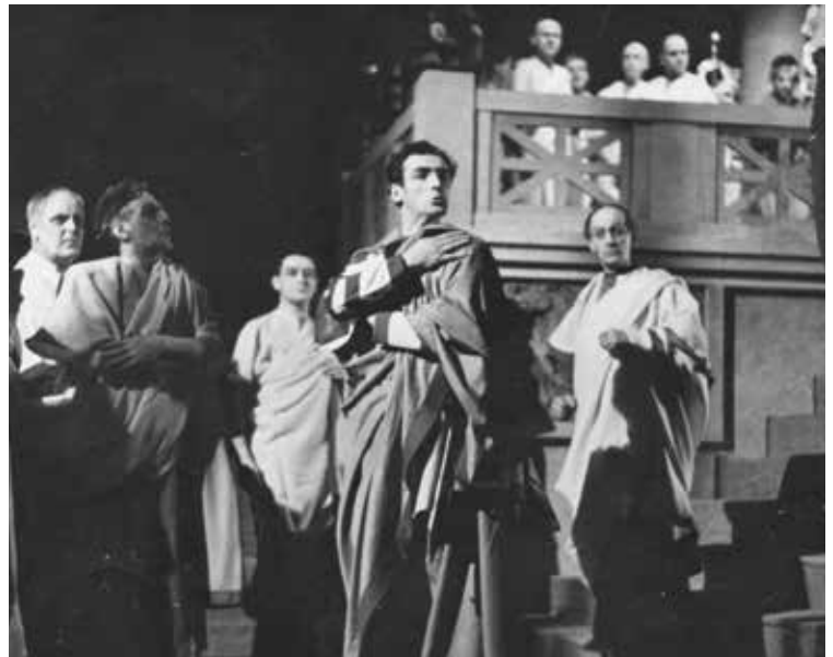
Кориолан , 1936.