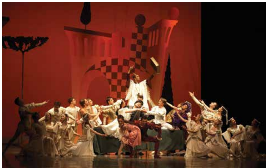
Укроћена горопад , 2009.